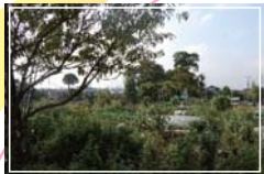
建設工事着工前 何もない、本当に ただの農地だっ たんです。