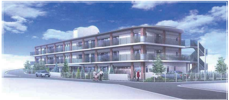
これが我らの目指す目的地“サンライズ大泉”