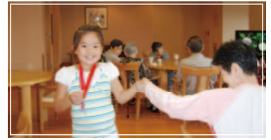
■ アクティブ・ジュニアアパートナー活動の様子