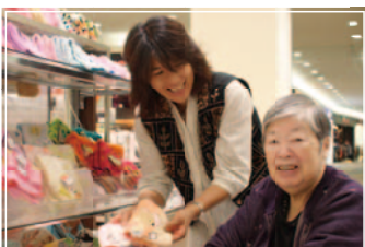
■アクティブ・ジュニアパートナー活動風景