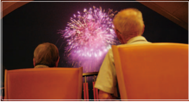
■ 7月 日の出まつり

『日の出町ふるさと夏祭りの花火は最高!の一言ね。自分の庭で花火があがるようなものだから1等席。皆さんなかなか外にまで花火は見に行くわけにはいかないでしょう。今年も早くから席について、首をながーくして花火があがるのを待つつもりですよ!』