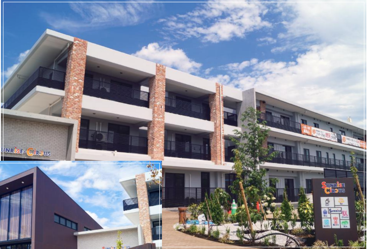
■ 竣工間近 サンライズ大泉

発行元 ■ Peaceful Partners Community (芳洋会後援会) 住所 ■ 東京都西多摩郡日の出町平井3076 ひのでホーム内 PPC事務局 電話 ■ 042-597-2021(代) FAX ■ 042-597-1973 e-mail ■ info@h-sunrise.com