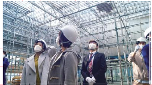
● サンライズ・サーカス内部を見上げて