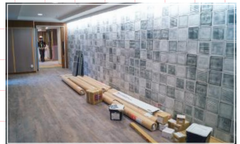
● 新ユニット・エレベーターホール