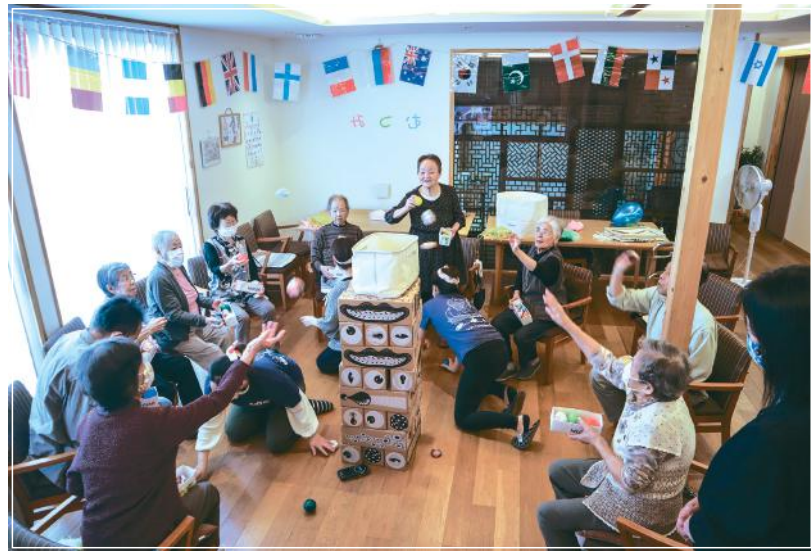
■サンライズむつみ橋 玉入れ

結果、種目は玉入れ、風船バレー、輪投げに決定。どんなADLの方でも参加できることも大切なポイントでした。当日の飾りつけは各事業所が行い、紅白の鉢巻を巻いて、さあいいよ本番。皆で画面を見ながら「あそこは玉入れの籠から近いんじゃない?」「あ!○○さんだ!元氣そうだね」などと、楽しみながらも闘志を燃やし、職員も飛び上がって喜びました。総合順位は