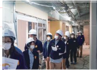
● 建設現場見学会を実施