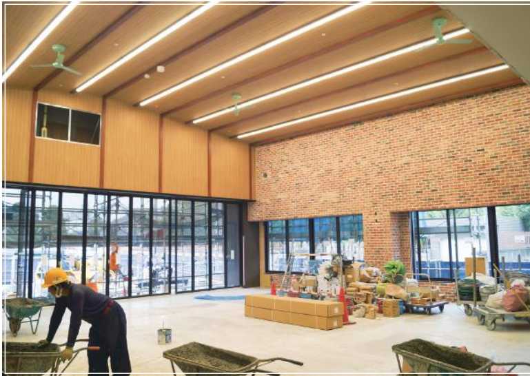
● カフェ・フィットネス・ランドリー・お風呂 地域の皆様が集まる場所

増床する特養に併設して、防災拠点型地域交流スペースを開設します。 「サンライズ・サーカス」には大人も子どもも自分らしく輝ける場所という意味が込められています。現在、建設準備中のサーカスの仕掛けを紹介します！