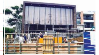
● サンライズ・サーカス正面