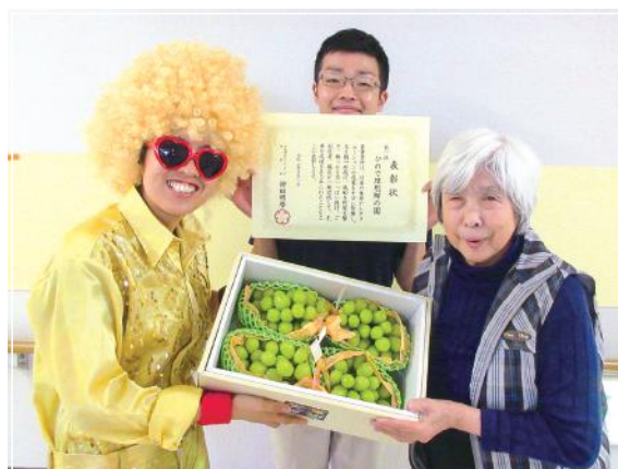
■表彰 (シャインマスカット)

株式会社クオリティサポート／有限会社吉澤自動車／八州環境保全有限会社／株式会社たまエンドレス／リコージャパン株式会社／有限会社あつぷ印刷工房／株式会社西部住設／有限会社ニーズ／中村屋商店／そうしんホール青梅／株式会社多摩電業／神田保険事務所／有限会社神建装／今井労務管理事務所／有限会社田中石油店／株式会社エムケーキクリーン／AKIRA Design Works／医療法人 明法会／株式会社MOGAKU／今井理容／株式会社クレス／株式会社オガワ防災