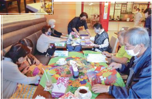
■八王子桑都手ぬぐいより