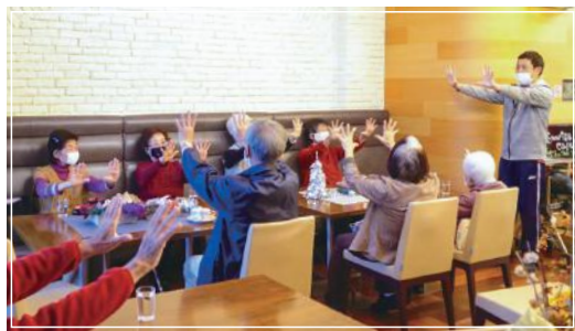
■ヨガマスターに学ぶ会

んが来て包み方を習ったり、各々の話が盛り上がりながら、参加者で同じ体験をする時間を楽しんでいきます。日の出町の人口はおよそ1万6千人、うち65歳以上人口は約6千人です。2年越しのコロナ禍で緊急事態宣言、まん延防止等重点措置などがとられると、そうした方々が利用してきた福祉センターは使えず、コミュニティバスは人数制限がある等どこかに出かけようと思ってもまだ