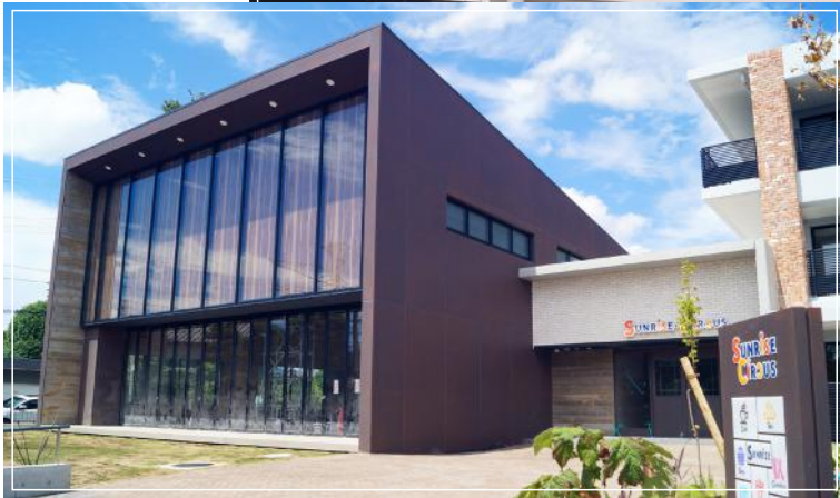
■ 竣工間近 サンライズ・サーカス