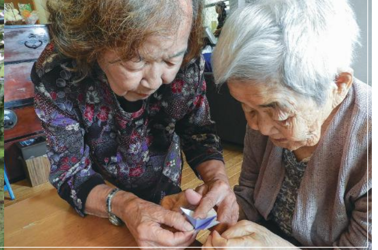
■ 芳洋会フォトコンテスト2019 with 広報委員会

この情報紙が会員の皆様のお手元に届くころには非常事態宣言も解除され、少なからず以前の日常生活に戻られていると思いますが、まだまだコロナウイルスとの闘いは終わりません。個々の好意がまとまれば人と人とを結びつけ、大きな福祉の輪になることを目指して、皆様からお預かりした浄財を、施設利用者への各種サービスへの援助、各事業所のスタッフの支援、地域社会への福祉貢献等に活用、運営してまいります。今後とも会員の皆様の温かいご支援、ご協力をお願い申し上げます。